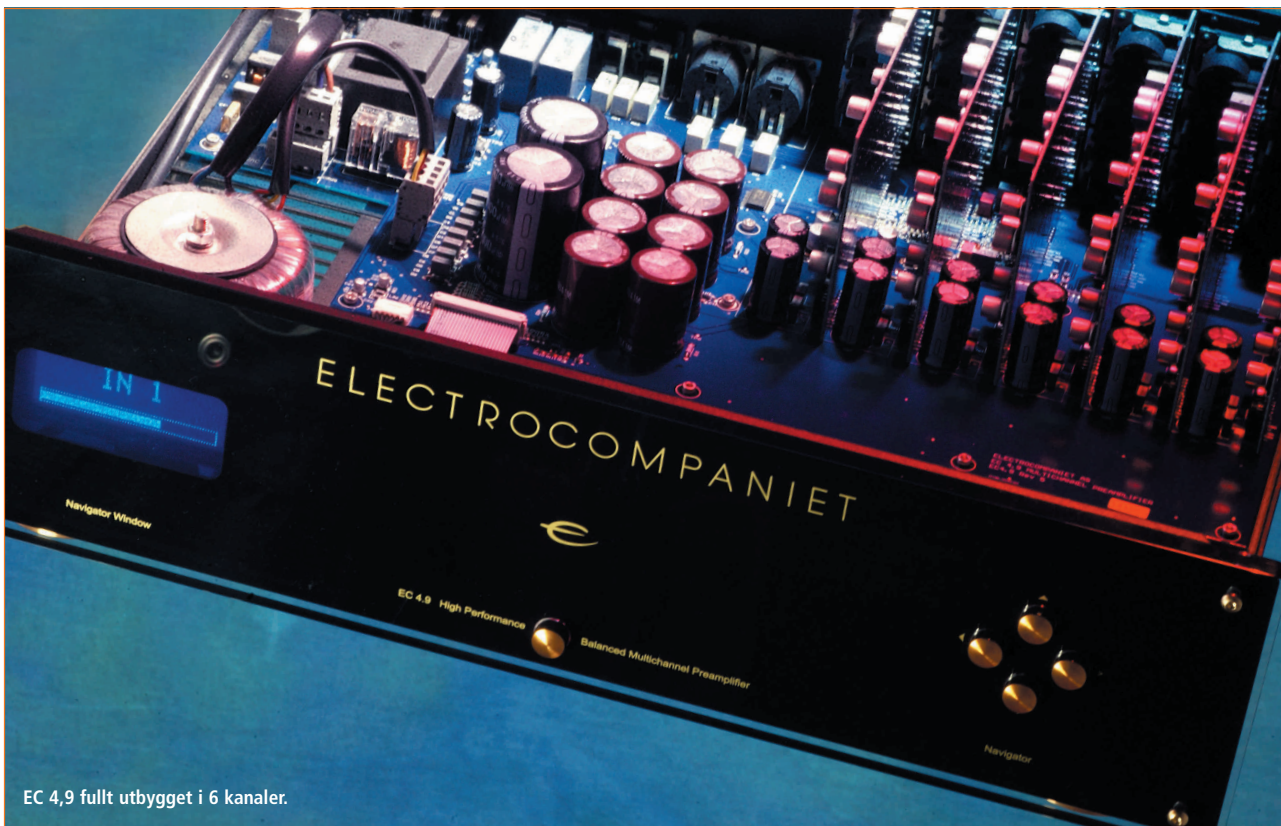
EC 4,9 fullt utbygget i 6 kanaler.

som uansett blir strammere og mer "korrekt" i NEMO konfigurasjon.