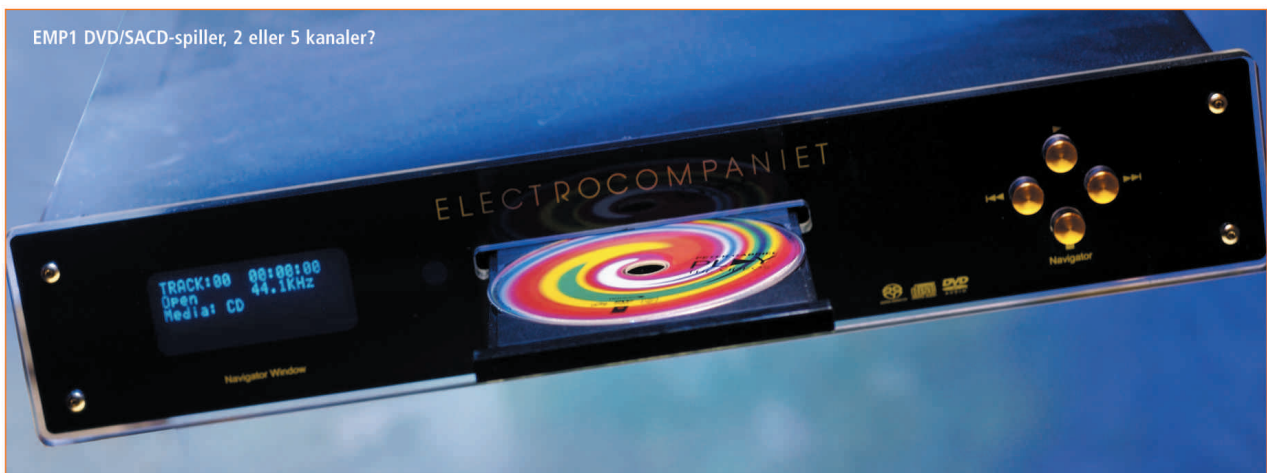
EMP1 DVD/SACD-spiller, 2 eller 5 kanaler?

Siden vi presenterte den smarte forforsterkeren 4,9 i nr. 22, og allerede har hatt små reserverasjoner for lyd-kvalitet i forhold til mer kostbare stereo high-end kontrollforsterkere, går vi raskt til de oppkoblede effektforsterkerne. Disse er de helt nye AW 120 i 2 eller 3 kanal med modellbetegnelsen M. Dette er nyutviklede varianter av den sedvanlige 120 watteren som mange mener er den "beste" forsterkeren Electrocompaniet har lansert. Dette fordi denne forsterkeren er litt slankere og strammere enn "rørlyden" fra AW 180, men uten å forsake det store lydbildet med den generelt varme grunn-tonen og elegante diskanten. Mange vil mene at 120 watteren er mer ærlig og presis, om ikke nødvendigvis like forførende som 180 watteren